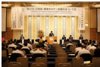
セミナー・研修会