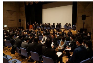
極微量物質研究会 （セミナー）