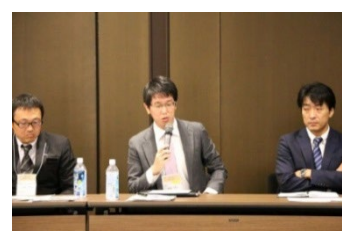
トークセッション