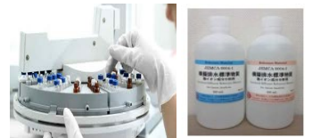
国の環境計量事業サポート