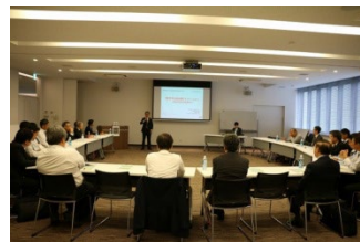
関係団体との交流