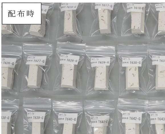
写真 3 試料 G