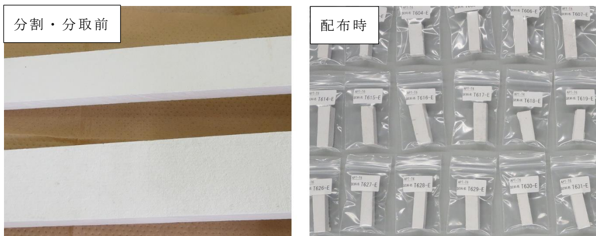
写真 1 試料 E

試験に用いた試料（分割・分取前、及び配付時）の画像を写真 1～写真 4 に示す。