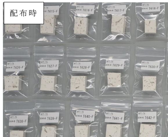
写真 2 試料 F