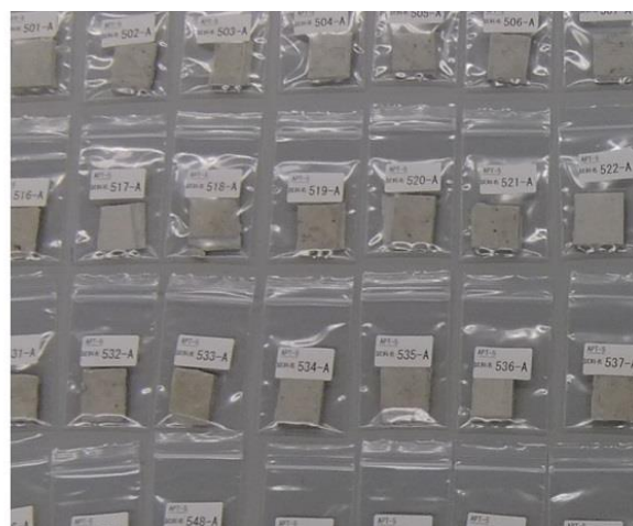
写真 1 試料 A