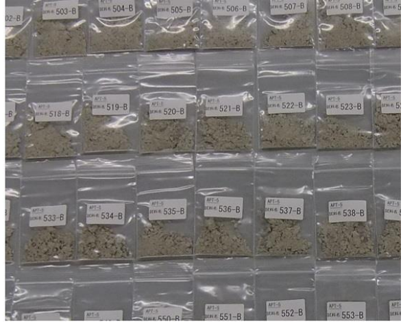
写真 2 試料 B