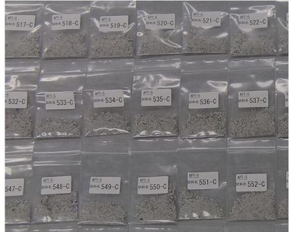
写真 3 試料 C