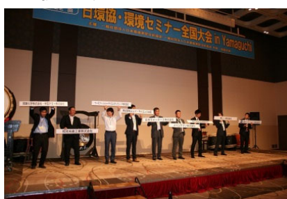
機器展示会場（商談ブース）