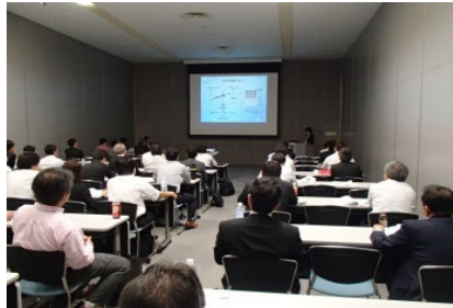
技術発表／ランチョンセミナー