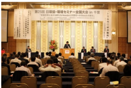
環境セミナー開会式

★年1回開催される経営セミナーでは機器導入に決定権を持つ方々と繋がる事が出来ます。経営セミナーには経営層の方々が多数出席されます。セミナー以外に硬軟織り交ぜた各種イベントが企画されますので、決定権のある方々と面識を作り、繋がる事が出来る大きなチャンスがあります。