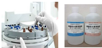
国の環境計量事業サポート