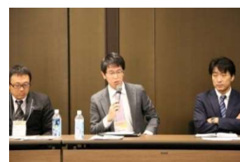
トークセッション