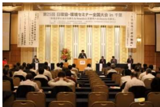
セミナー・研修会