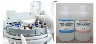
国の環境計量事業サポート