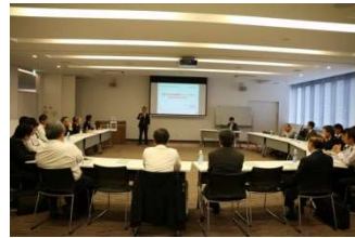
関係団体との交流