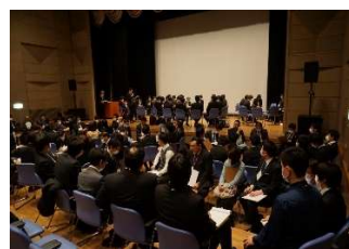
極微量物質研究会 （セミナー）