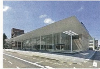
金沢商工会議所会館

■参加申込の詳細は、当協会のホームページ《 http://www.jemca.or.jp/info/ 》を参照ください。