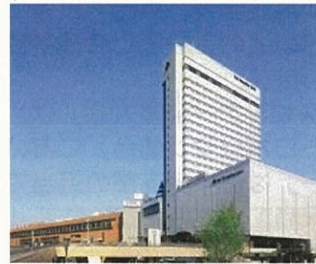
ホテルメトロポリタン仙台

■参加申込の詳細は、当協会のホームページ《 http://www.jemca.or.jp/info/ 》を参照ください。