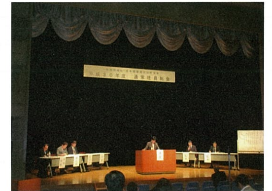
平成30年度 通常社員総会 会場風景