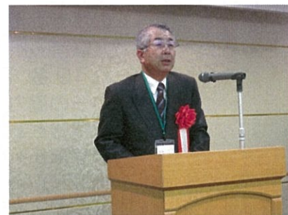
功労者挨拶【森脇氏】