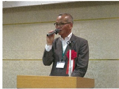
功労者挨拶【高田氏】