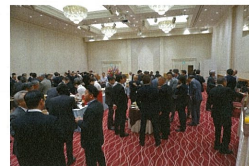
平成30年度 通常社員総会 懇親会風景