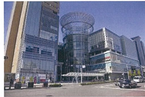
サンポートホール高松

■参加申込の詳細は、当協会のホームページ《 http://www.jemca.or.jp/info/ 》を参照ください。