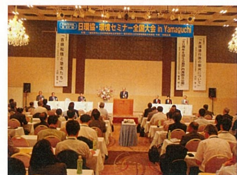
開会セレモニー風景 (in 山口)