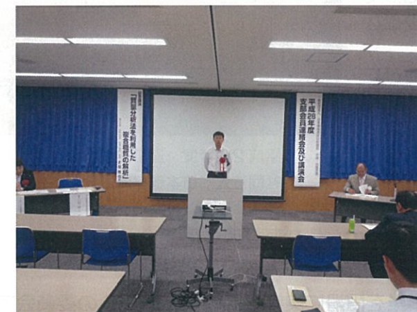
岡山県環境文化環境管理課 楠奥様 祝辞挨拶