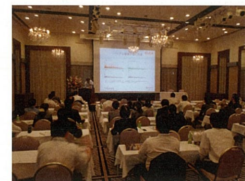
技術発表風景 (in 山口)