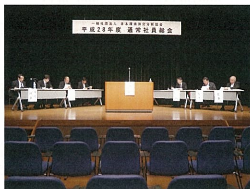
平成28年度 通常社員総会 (一般社団法人 日本環境測定分析協会)