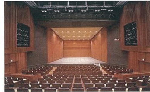
会場(サンポートホール)