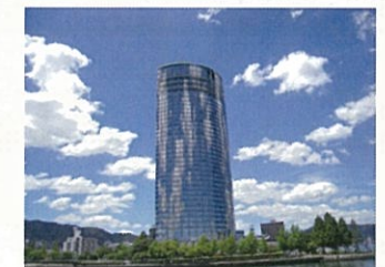
大津プリンスホテル

今回の参加者は約383名で、近年では最も多い参加者となり、大盛況でした。平成28年度の環境セミナー全国大会は、中部支部にバトンタッチとなります。