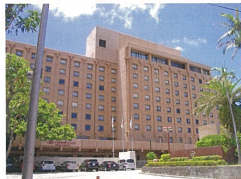
ANAクラウンプラザホテル沖縄 ハーバービュー

特別講演の後の懇親会では、「沖縄の歌と踊り」をご披露いただき、宴会場は沖縄独特の雰囲気になりました。