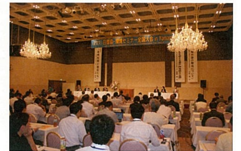
環境セミナー全国大会 in Yamaguchi 開催風景（平成26年度）