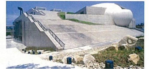
長良川国際会議場

上記内容は、現時点での開催案です。詳細は、当協会のホームページでご確認ください。