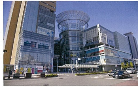
サンポートホール高松

また、会員の皆様方におかれましても、「経営者セミナー」を開催するに当たり、アイデアや提案などがありましたら、事務局まで連絡ください。