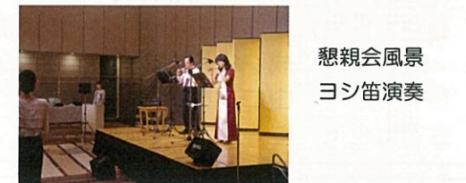
懇親会風景 ヨシ笛演奏