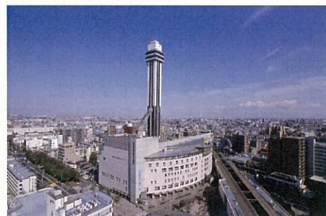
タワーホール船堀 (日環協 通常社員総会開催場所)