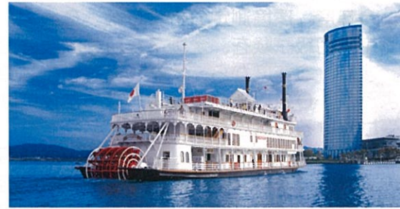
大津プリンスホテル

■参加申込の詳細は、当協会のホームページ《 http://www.jemca.or.jp/info/ 》を参照ください。