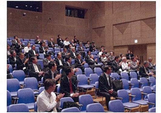
通常社員総会議案審議風景