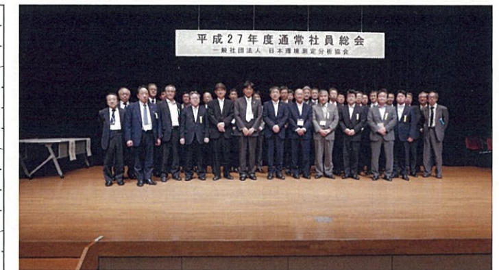
一般社団法人 日本環境測定分析協会 新役員メンバー