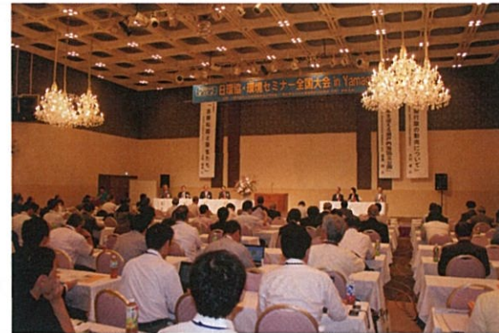
開会セレモニー風景