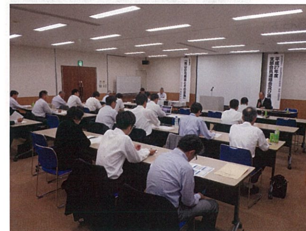
支部会員連絡会審議風景